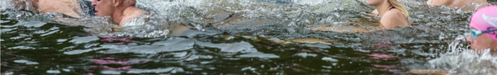
Från 2017-års Hensmåla Triathlon för als-insamling.